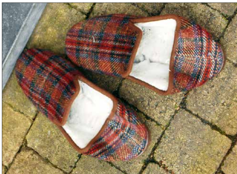
▲ Gedeelde tweede plaats voor de sletsekes van een ware held...