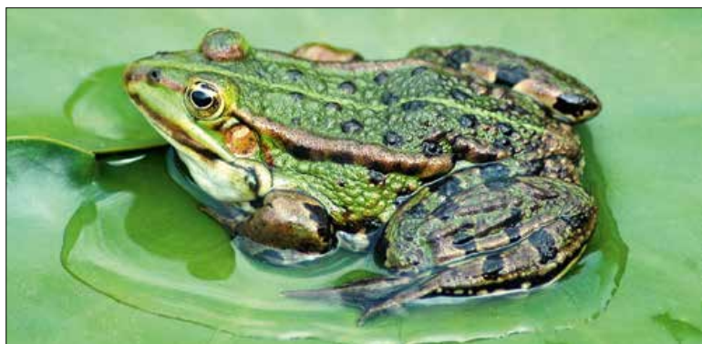
▲ Den oaktepuut, zilveren tweede in de stand.