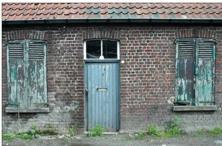
▲ De blaffetuurkes zijn gesloten... In dit geval (Sportstraat) al lang...