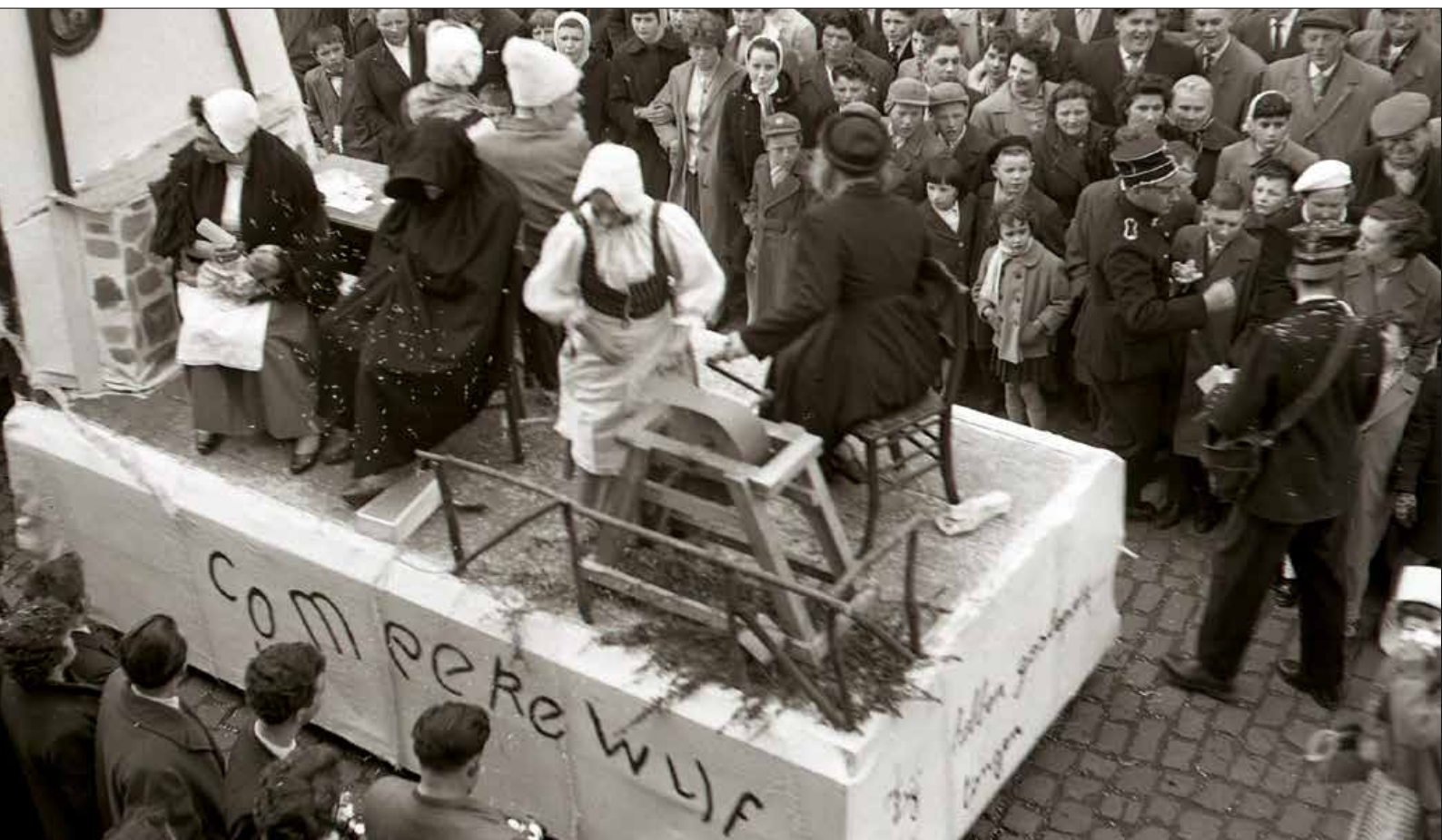
▼ Een groep “commeerewijven” in de Knesselaarse carnavalstoet van 1960.

Andere topvermeldingen zijn speddelingen (spatten), stroatzeile (straaloper, vrouw), hemelaweirke (leeuwe-rik), paddernoize (patronaatszaal, feestzaal), oalkerdeel (17, beerkar, gierwagen), kortwagen (kruiwagen), kweene (kwezel, heks), peirdemeester (veearts), perseen (rolluik), pekking (een “vedding”, een pak slaag), piesoog (tip-oog), schaffeloare (een sukkelaar), toespelle (veiligheids-speld), tsjiebe (kip), veure (veur), doeize (16; fopspeen), klakkebosse (speelgoed, instrument), kopke (postzegel), oliedits (oliebol), rekkerspriet (katapult, speelgoed), spel-lekoter (woonwagenbewoner), stude (boterham), veuj (klep van een muts), wilfant (wild kind), zoedekoeke (peperkoek), goele (domme vrouw), carnesjeire (boe-kentas), dilte (hooizolder), kaantje (uitgebakken spek-rand), knechtebrakke (kwajongens), mesjonk (meisje), oale (aal, beer, mest), schei (magere persoon), schruigel (schreeuw), vertrek (wc), zeupe (slok), zeuraare (iemand die oneerlijk speelt), vremmens (15, vrouw), fer-nes (ketel waaronder vuur wordt gemaakt), grebbe (grop-pel, goot, strook aan beide zijden van de weg, waar het regenwater naar de riool loopt).