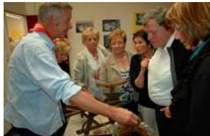
DEMONSTRATIE SIGAREN MAKEN. 25 APRIL 2009