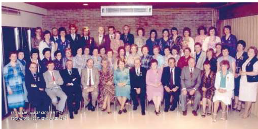
EEN VAN DE LAATSTE GROTE FEESTEN. EIND JAREN 1970

Ten gevolge van de toenemende internationale concurrentie en de mechanisatie verdwijnen tientallen sigarenfabrieken in Vlaanderen. Ook in Knesselare voelt men nattigheid.