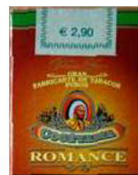
DE ROMANCE-SIGAAR. FOTO PAUL VERHOESTRAETE, 2009

De 'Romance'-sigaartjes die nu nog onder de naam Cogétama geproduceerd worden en nog steeds te koop zijn, worden door Wintermans gemaakt in Leuven. Ze zijn de laatste restjes van een verhaal dat anderhalve eeuw geleden begon in Gent, iets later Knesselare een economische betekenis en meer sociale welstand bracht, maar vervolgens ook weer ten einde liep onder de druk van weer evoluties en belangen.