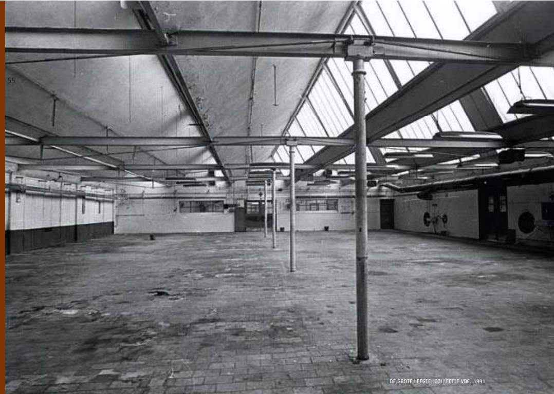
DE GROTE LEEGTE. COLLECTIE VDC, 1991

Sommige werknemers vinden werk in de andere bedrijven in de buurt. Voor anderen is er een financiële regeling die niet altijd als ongunstig wordt bestempeld. In vakbondskringen werd vernomen dat er om en bij de 9 miljoen oude Belgische frank zou kunnen verdeeld worden onder de werknemers.