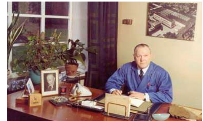
HILAIRE GAAT MET PENSIOEN. 1978

Wij wensen u nog vele jaren Vol goede moed, in blijde kring! De geur van tabak en sigaren Zij u een zoete herinnering