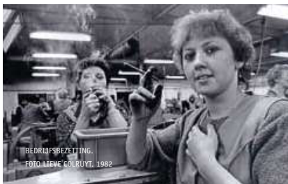
BEDRIJFSBEZETTING. FOTO LIEVE COLRUYT, 1982