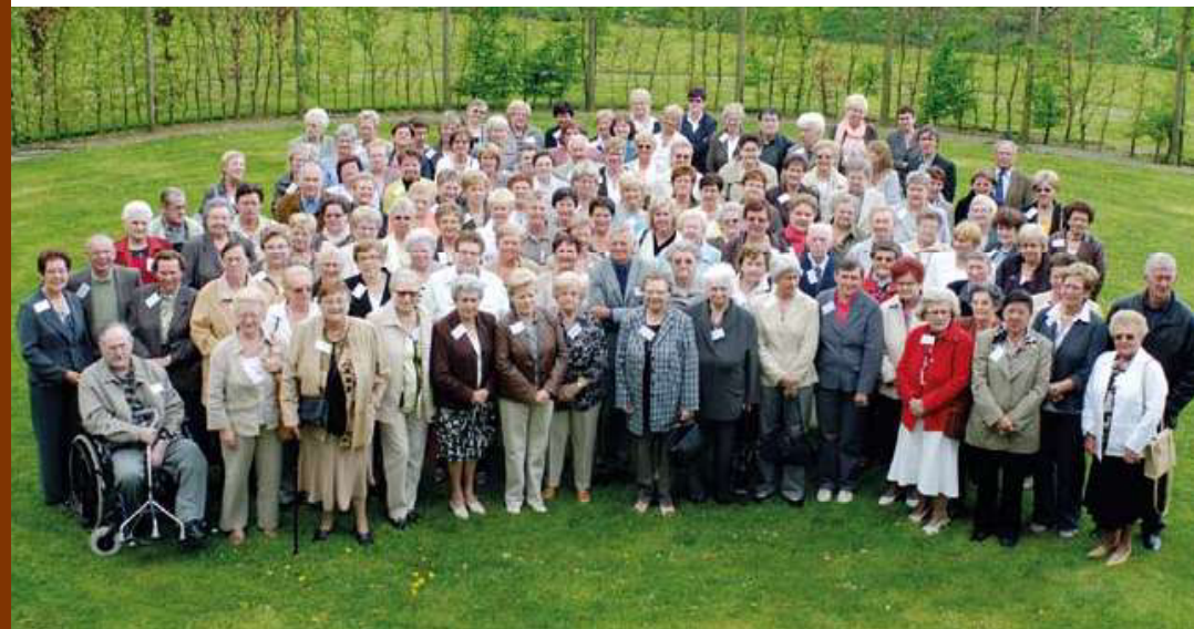
GROEPSFOTO. 25 APRIL 2009

26 jaar na de sluiting brengt Cogétama dankzij het erfgoedproject mensen bij elkaar. Een gemeenschap komt opnieuw samen. Niet om te werken, niet om te protesteren tegen de fabriekssluiting, maar om herinneringen en meningen uit te wisselen. Vandaag zijn berusting en verbondenheid de sleutelwoorden.