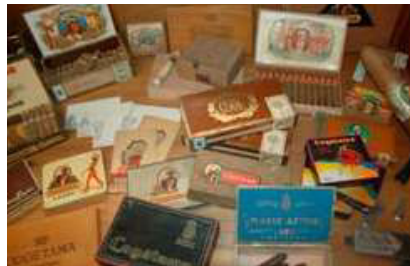
DE TENTOONSTELLING. 25 APRIL 2009