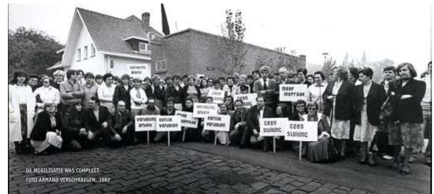
DE MOBILISATIE WAS COMPLEET. 1982

Op maandag 27 september 1982 is de ondernemingsraad van Cogétama in spoedzitting bijeen. Cogétama moet dicht. De dag nadien worden de vakbonden ingelicht en op donderdag is er een persconferentie.