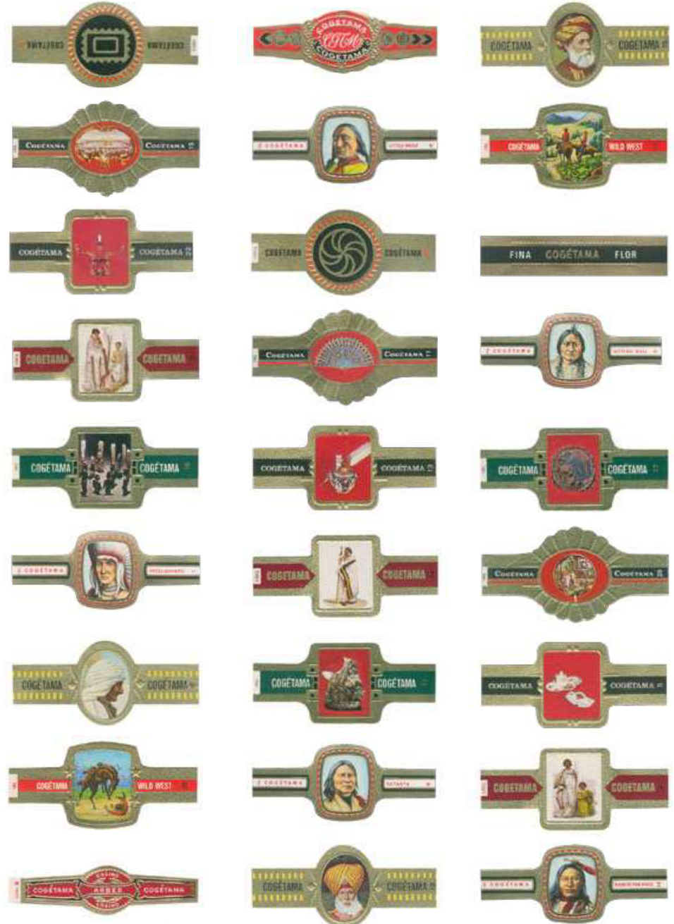
SIGAREN BANDJES. COLLECTIE HUGO GYSELBRECHT