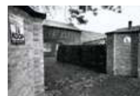
FABRIEK TE KOOP. FOTO ARMAND VERSCHRAEGEN, 1990

Het machinepark verhuist naar Leuven, de gebouwen blijven zelloos leeg staan. Het is april 1986 als uit de gemeentebegroting valt af te leiden dat de gemeente Knesselare de fabriek wil kopen voor 12 miljoen Belgische frank. Maar de meerderheid (Gemeentebelangen) struikelt wegens politieke dissidentie over het dossier.