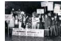
ACTIE IN GENT. 1982

Tabacofina beheert op dat moment een holding van 16 filialen en plantages in onder meer Zaïre, Indonesië en Brazilië, samen goed voor 5.800 personeelsleden.