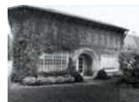
DE BUREAUS WACHTEN OP EEN NIEUWE BESTEMMING. FOTO MICHIEL HENDRYCKX, 1988