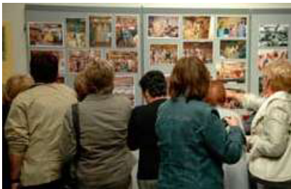
DE TENTOONSTELLING. 25 APRIL 2009