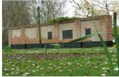
DE LAATSTE MUUR DIE REST VAN DE SIGARENFABRIEK. FOTO CULTUURDIENST KNESSELARE, 2008