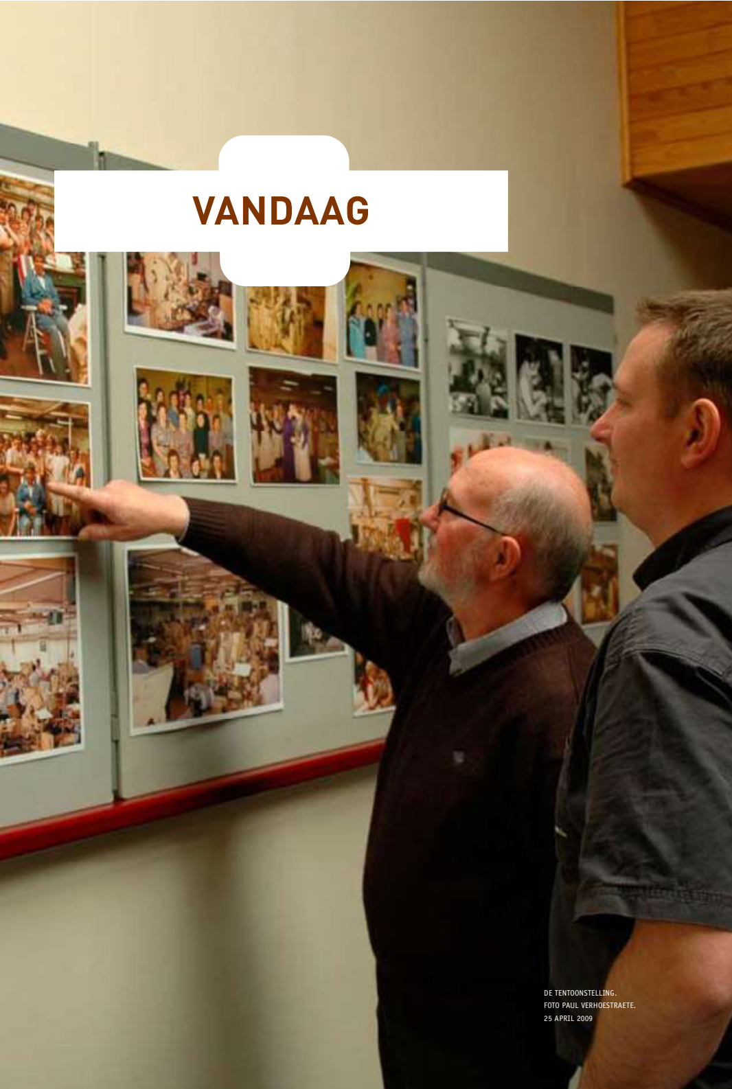
DE TENTOONSTELLING. 25 APRIL 2009