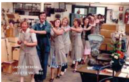
LAATSTE WERKDAG.

Op donderdag 30 juni 1983 gaan de deuren definitief dicht. De werknemers zitten nog één keer rond hun machines. Sommigen werken nog, anderen roken een sigaretje. De lokale radio Saturnus draait 'Coeur blessé' van Petula Clark. En nadien gaan ze nog eens samen eten. De woede heeft plaats gemaakt voor gelatenheid en berusting. 'Solidariteit? Geen glimp meneer, niks, helemaal niks. Vakbonden? Laat me niet lachen', aldus een van de werknemers in Het Nieuwsblad. Nu is er enig begrip voor de schaarse solidariteit in de andere filialen van Tabacofina.