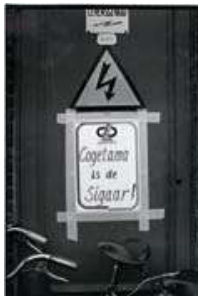
COGETAMA IS DE SIGAAR. FOTO ARMAND VERSCHRAEGEN, 1982

Uit: De Keyser L., Cogetama houdt de adem in, Het Nieuwsblad, 4 oktober 1982