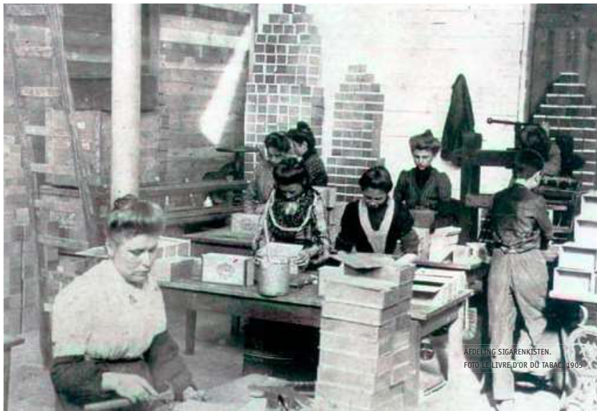
AFDELING SIGARENKISTEN. FOTO LE LIVRE D'OR DU TABAC. 1905

Rond 1830 ontstaat ook de sigaret (tabak in papier gerold). Deze rookgewoonte verspreidt zich heel snel. Tabaksfabrikanten spelen in op deze mode en in 1884 wordt de sigarettenmachine in Amerika uitgevonden. 'Voorgerolde' sigaretten veroveren de markt en de sigaret wordt zeer populair vanaf de eerste helft van de 20ste eeuw.