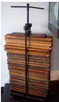
SIGARENFORMPERS. NATIONAAL TABAKSMUSEUM WERVIK. 2009

Tussen de twee wereldoorlogen krimpt de tabaksproductie, maar verdwijnen vooral veel kleine sigarenmakerijen. De grote hergroeperen zich en verdwijnen in een kluwen van multinationals. Na de Tweede Wereldoorlog wordt handenarbeid vervangen door machines. De concurrentie wordt hard, de uitvoer krimpt en de productie volgt. Zeker als nog wat later de rookgewoonten drastisch veranderen. De Knesselaarse Cogétama-fabriek sneuvelt mee in die ontwikkeling. In 1983 staat de radio in de werkzaal voor het laatst loeihard. Daarna zwijgen de machines. Het lied van generaties sigarenmakers valt stil.