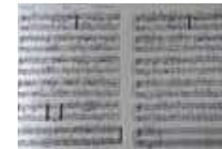
COGETAMA-MARS. EEN COMPOSITIE VAN GERARD VAN DE CASTEELE. FOTO PAUL VERHOESTRAETE, 2009

Wie er langs komt, kan het nog nauwelijks merken. In de diepte van de Knesselaarse Kerkstraat herinnert vooral nog het groen van de wijdsde locatie aan een bijzonder verleden. Op die plek stond in de vorige eeuw een fabrieksgebouw waar honderden arbeiders hard werkten, maar tegelijk veel vriendschap vonden en vooral een inkomen dat hun de kans gaf een stuk comfortabeler te leven dan in andere landelijke gemeenten het geval was.