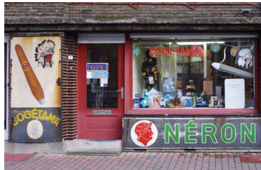
HET LAATSTE TABAKSWINKELTJE IN KNESSELARE. 2009

Onze bijzondere dank gaat naar alle mensen die hun verhalen, hun herinneringen – onder welke vorm ook – met ons hebben gedeeld.