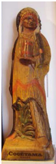
COGÉTAMA-BEELD. NATIONAAL TABAKSMUSEUM WERVIK. 2009

Tien jaar na de ontdekking van Amerika wordt de eerste tabak gekweekt in Spanje, kort daarna in de Spaanse Nederlanden. Almaar meer zeevaarders brengen